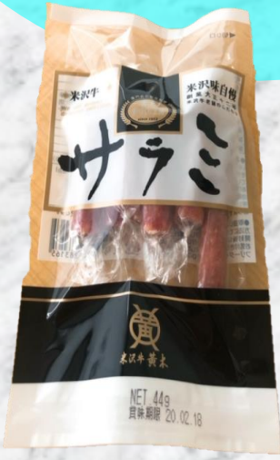
↑O君の実家で作っているジャーキーです！

2020年末に某アイドルグループや某アーティストの活動休止。それと同時に上野動物園のアイドルのパンダの中国に返還と…2020年の終わりは悲しみに明け暮れそうです。この1年、応援しまくりましょう！